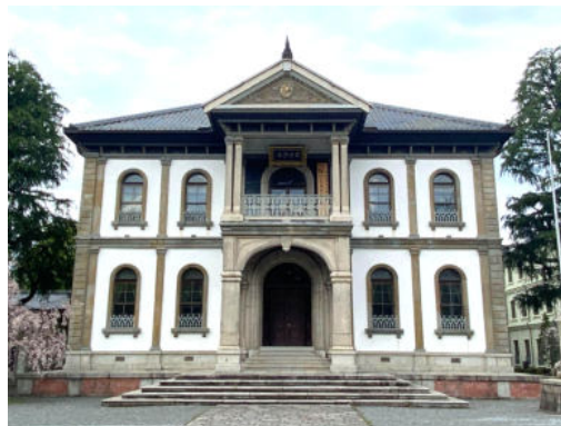
龍谷大学大宮学舎