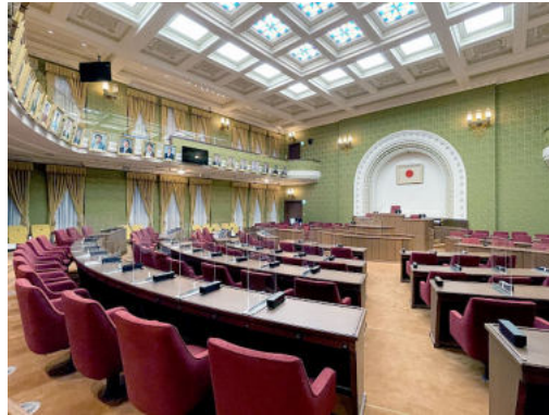
京都市役所本庁舎 市会議場