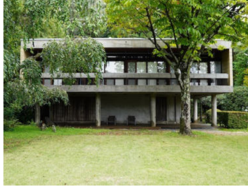
衣笠山の家(小林邸)