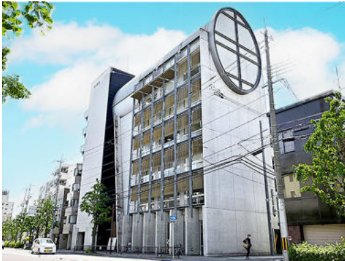
毎日新聞京都ビル