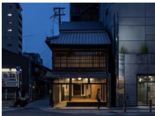
郭巨山会所