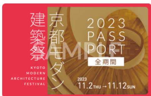
パスポート(全期間)