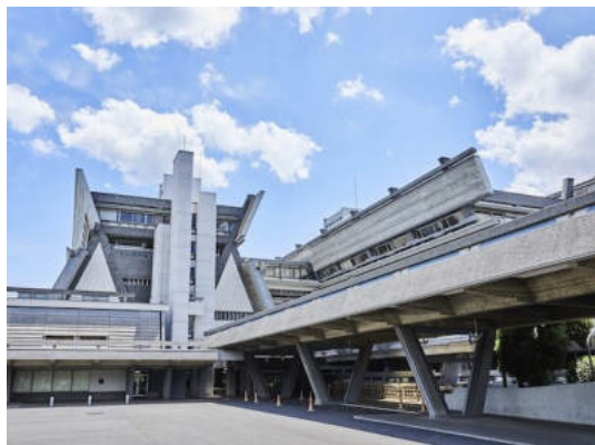
国立京都国際会館