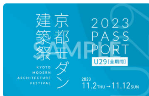
U29パスポート(全期間)